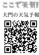
ここで天気 大門の天気予報

3月23日は「世界気象 デー」です。世界各国の 協力のもと、気象予報に 必要な技術や情報を互い に提供しています。自然 災害を少しでも減らしたり、 より住みやすい環境をつ くるため、多くの人が手 を取り合うことが大切に すね。